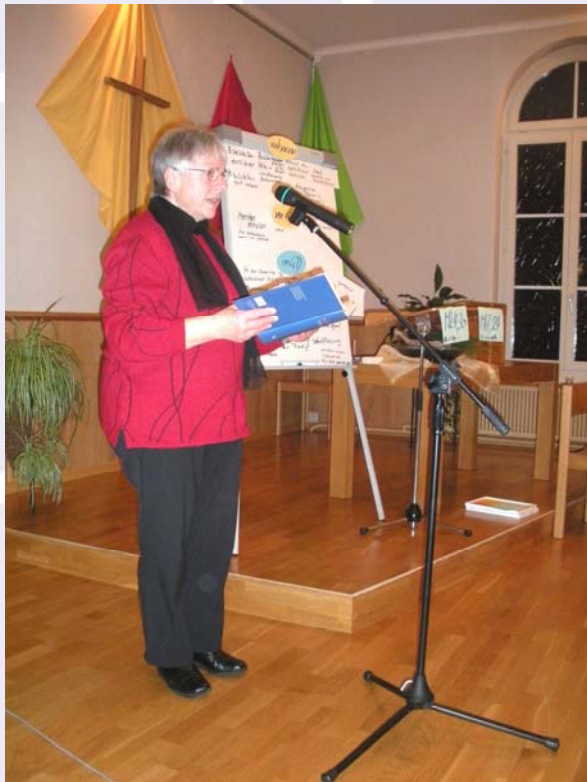
Schulungsteilnehmerin in Signau